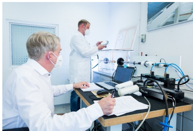
Abbildung 1: Durchlassgrad Prüfstand TÜV NORD (Messkammer mit Palas Photometer Welas®)

Das Ziel: Sicherstellen, dass die Messergebnisse des Prüfstandes PMFT 1000M (Palas GmbH) vergleichbar mit denen einer benannten Stelle (EN 149 konforme Prüfung) sind. Der PMFT wird von Maskenproduzenten zur Qualitätsüberwachung verwendet.