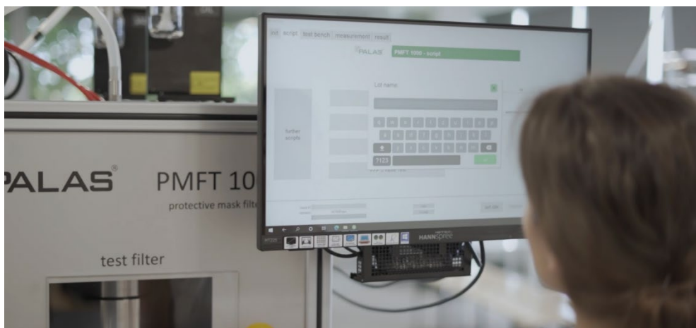
Abbildung 2: Prüfstand PMFT von Palas