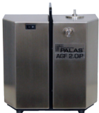
AGF 2.0 iP Version mit integrierter Pumpe