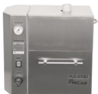
PLG 2100 S Version mit automatischer Nachfülleinheit