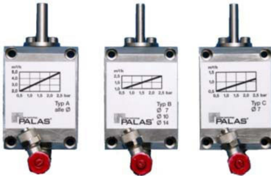
Abb. 3: Dispergierdeckel Typ A, Typ B und Typ C Für die optimale Dispergierung können vier verschiedene Dispergierdeckel (siehe Abb. 3, weitere Details unter Zubehör) eingesetzt werden.