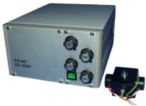
CD 2000 A 型 混合空气流量较低的版本